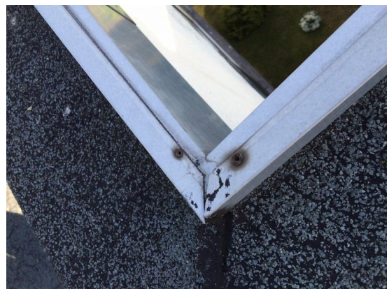
Abbildung 3: Kabelabdeckung Dachkante

Von der Ecke im Innenhof, die direkt über dem Eckfenster der Kulturlobby ist, wird das Kabel an der Fassade schwingungsfrei verlegt und im Erdgeschoss fixiert. Im Erdgeschoss wird das Kabel in einem Hohlraum hinter der Fassade bis zum Gebäude Eintrittspunkt durch Klemmvorrichtungen befestigt. Um mit dem Kabel wieder ins Gebäude zu kommen, wird ein Netzwerk-Flachbandkabel genutzt, welches in die Fensterfalz gelegt wird, ohne die Dichtungseigenschaften des Fensters zu beeinträchtigen.