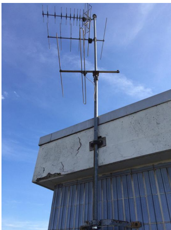
Abbildung 2: Antennenmast

Für die Verlegung des Netzkabels zur Kulturlobby im Erdgeschoss kann am Dachaufbau das vorhandene Kabelrohr (Abb. 2) und an der Dachkante die vorhandene Kabelabdeckung (Abb. 3) genutzt werden.