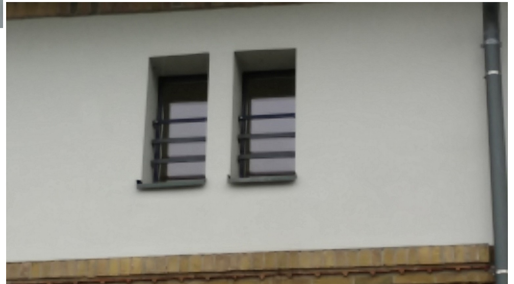
Abbildung 2: Trollwerkfenster