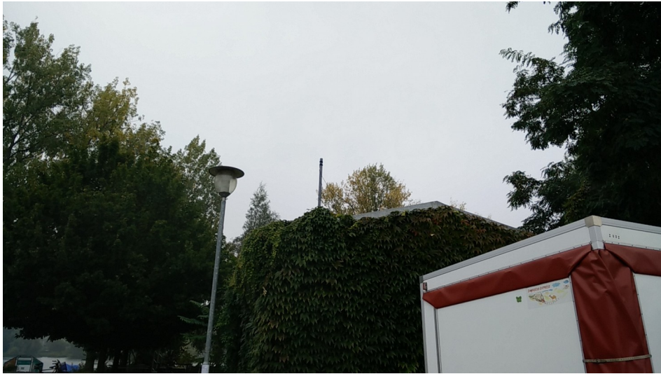
Abbildung 1: Mast Fabrik -Kiosk